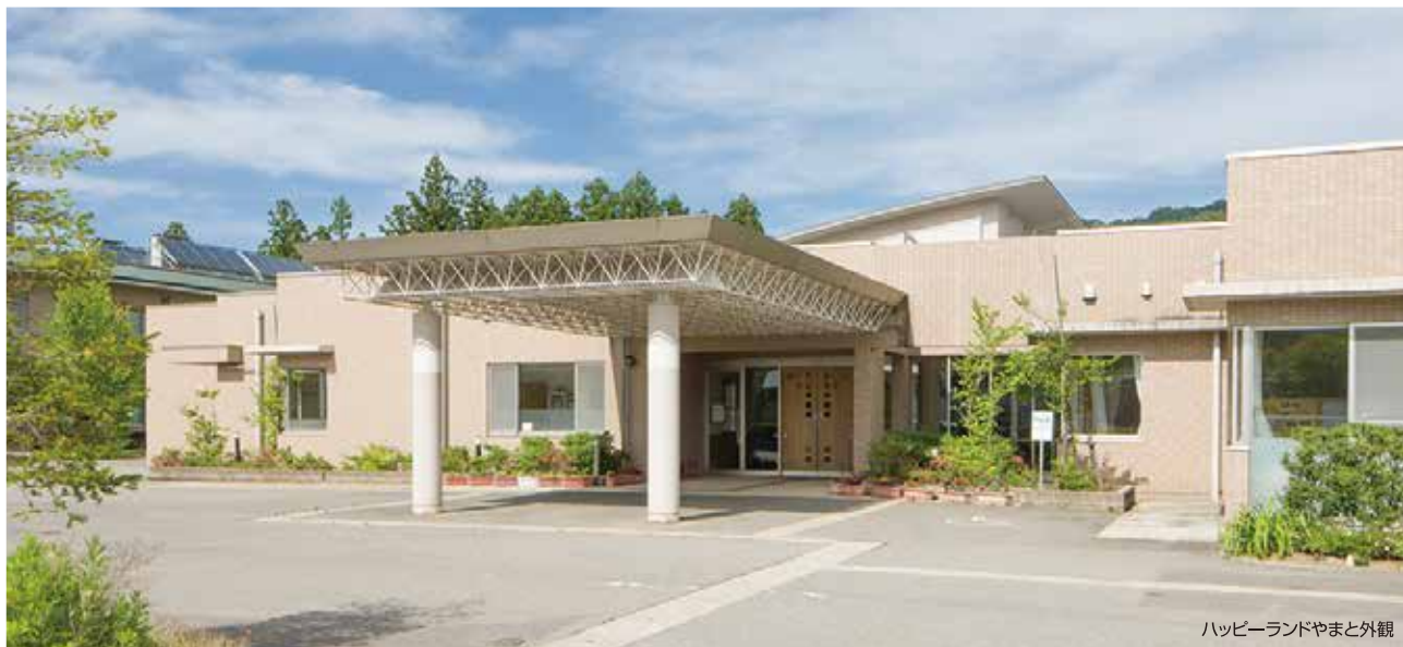
ハッピーランドやまと外観

ハッピーランドやまとは、老人福祉法に基づいて設置され、介護保険法の指定を受けています。利用される方に『いいでの里でやすらぎと喜びのある日常生活』をお届けするために、「常に笑顔と生き甲斐を尊重すること」を最優先に、「利用者の尊厳の保持」をケアの基本として、地域に開かれた家庭的な雰囲気の中で、利用者がその有する能力に応じた自立した日常生活を営むことができるようにサービスを提供します。また、短期入所サービスも行っています。