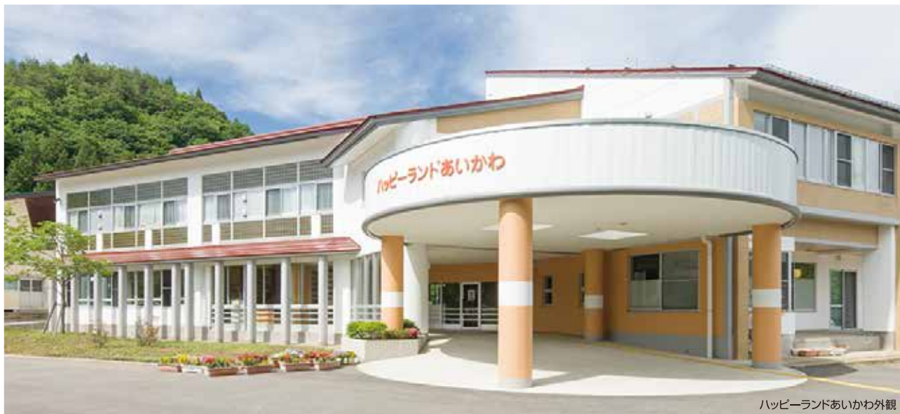
ハッピーランドあいかわ外観

旧山都第二小学校廃校に伴う跡地施設等活用公募型プロポーザル募集に提案し開設した介護保険法に基づく「全室個室ユニット型の地域密着型介護老人福祉施設」です。運営にあたっては、「特別養護老人ホームハッピーランドやまと」を本体施設としたサテライト型居住施設として、明るく開放的な空間の中で、その人らしさを尊重した個別ケアと住み慣れた地域でご家族、地域とのつながりを大切にしたいサービスを提供しております。